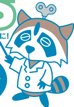
おしぼり研究ロボ テフキーくん